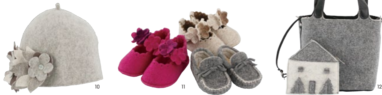
10. イタリア・ボローニャから届いたブランド「キアラ」のフェルトシリーズ。花の装飾がかわいらしい大人のフェルト帽 ¥10,500 11. フェリストシューズとしてプレゼントしたいベビーシューズ。デザイン違いで大人用もあるのでペアで贈っても素敵。¥6,300 (10cm~11cm) 12. 家モチーフのインバッグもかわいいバッグ。¥15,750 (縦18cm×横17.5cm×マチ12.5cm) / すべてキアラ。10月より展開予定。

真冬の素材といえば、ファー&フェルト。 見ているだけで温まりそうな素材に包まれて、身も心もウォーミング。