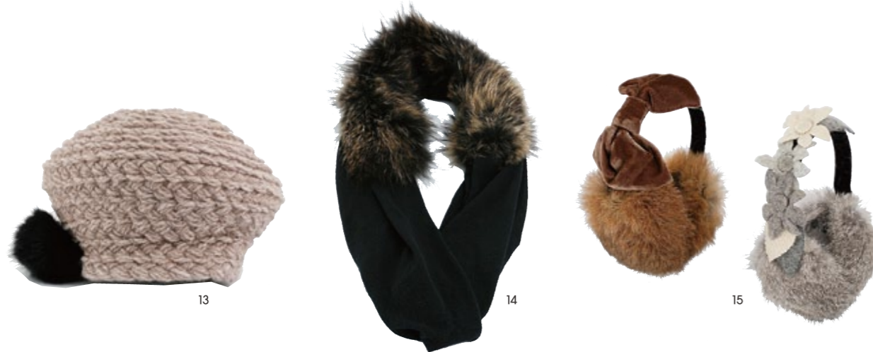
13. ニット&ファーの帽子は真冬の鉄板アイテム。ファーは取り外しも可能。¥19,950 / CM アッチェソーリ (10月より展開予定) 14. フィンランドクーンを惜しげもなくたっぷり使った贅沢なスヌード。巻き方次第でさまざまな楽しみ方も。¥68,250 / フランチェスカ パッシ 15. ヘッド部分がデザインされた珍しいイヤーマフ。大人が身に付けてこそ可愛らしさが映える。各¥14,700 / CM アッチェソーリ (10月より展開予定)