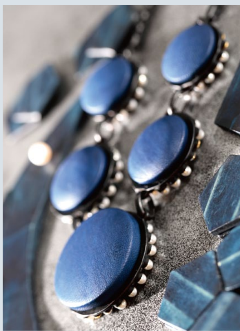
藍染木のネックレス ブローチ イヤリング 藍染革とパールのリバーシブルネックレス