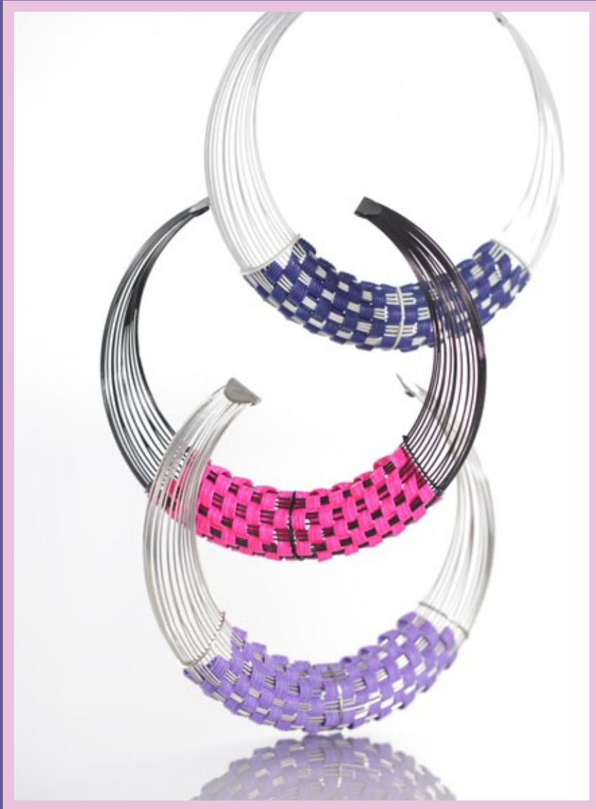
水引市松子ヨーカー