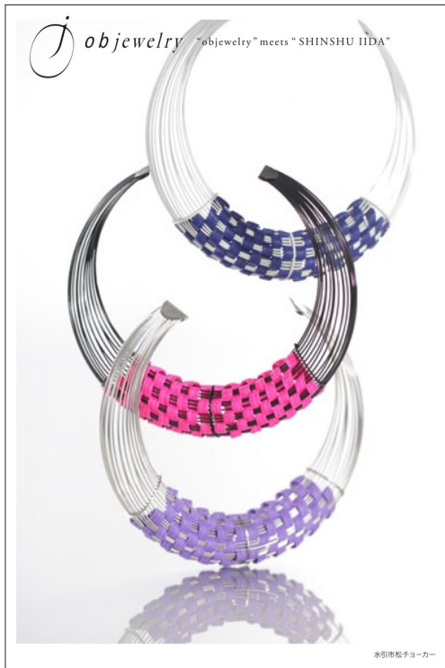
水引市松子ヨーカー